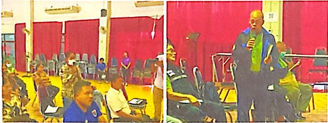
แบ่งกลุ่มปฏิบัติการ : การสำรวจ ค้นหาข้อมูล ปัญหา และแนวทางการปฏิบัติในการจัดการสิ่งแวดล้อมและระบบนิเวศโดยรอบบ่อขยะ