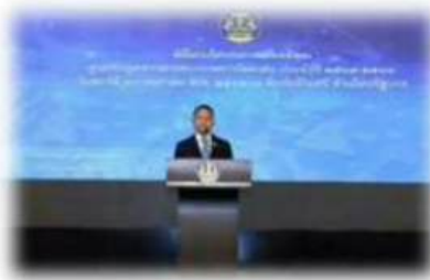
นายสมศักดิ์ เทพสุทิน รองนายกรัฐมนตรี