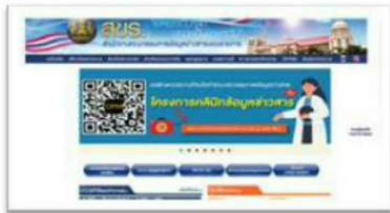
เว็บไซต์เดิม

๔.๙.๑ ปรับปรุงเว็บไซต์สำนักงานคณะกรรมการข้อมูลข่าวสารของราชการ โดยได้ปรับปรุงเมนู จำนวน ๕ เมนู เพิ่มเป็น ๖ เมนู คือ ระบบร้องเรียน/อุทธรณ์ออนไลน์ พระราชบัญญัติข้อมูลข่าวสารของราชการ พ.ศ. ๒๕๔๐ ประกาศคณะกรรมการข้อมูลข่าวสารของราชการ นโยบายคุ้มครองข้อมูลส่วนบุคคล คำประกาศเกี่ยวกับความเป็นส่วนตัว และเว็บไซต์ (กระทู้-ถามตอบ) รวมทั้งได้ดำเนินการปรับปรุงข้อมูลให้เป็นปัจจุบัน ประกอบด้วย คำวินิจฉัย จำนวน ๒๗๒ เรื่อง ตอบข้อหารือ จำนวน ๓๔ เรื่อง คำพิพากษาศาลปกครอง จำนวน ๑ เรื่อง และข่าวทั่วไป จำนวน ๒๒๘ เรื่อง พร้อมทั้งมีผู้เข้าเยี่ยมชม จำนวน ๒๐๗,๙๒๖ ราย