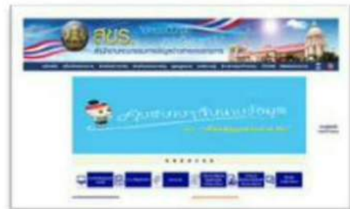
เว็บไซต์ใหม่

๔.๙.๒ การให้บริการระบบศูนย์ข้อมูลข่าวสารอิเล็กทรอนิกส์ของราชการ (Infocenter) มีหน่วยงานของรัฐขอใช้บริการทั่วไป จำนวน ๑๓๒ หน่วยงาน จัดทำตามโครงการจัดตั้งศูนย์ข้อมูลข่าวสารของราชการจำนวน ๑,๒๐๐ หน่วยงาน ดังนั้น หน่วยงานที่ใช้ Template ของสำนักงานคณะกรรมการข้อมูลข่าวสารของราชการ ทั้งหมด ๙,๖๗๓ หน่วยงาน พร้อมทั้งดำเนินการปรับปรุงข้อมูลหน่วยงานในศูนย์ข้อมูลข่าวสารแห่งชาติ จำนวน ๑,๘๘๑ หน่วยงาน และมีผู้เข้าใช้บริการศูนย์ข้อมูลข่าวสารอิเล็กทรอนิกส์ของราชการ สำนักงานปลัดสำนักนายกรัฐมนตรี จำนวน ๓๐,๘๖๕ ราย