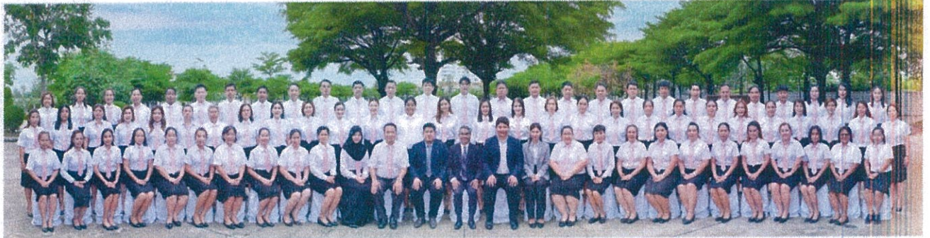
วันที่ ๑๒ พฤษภาคม ๒๕๖๗ ณ โรงแรมเดอะไฮลิค รีสอร์ท จังหวัดภูเก็ต

ระหว่าง วันที่ ๑๒ - ๑๓ พฤษภาคม พ.ศ. ๒๕๖๗