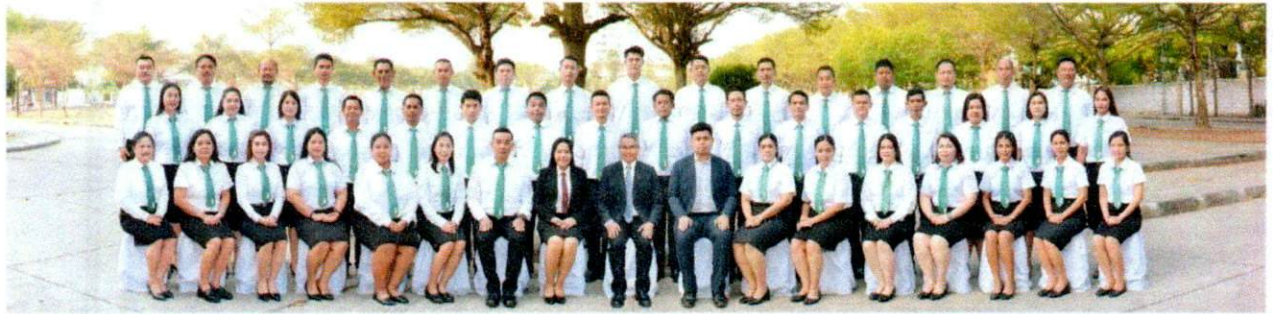
วันที่ ๖ มีนาคม ๒๕๖๗... (Small text describing the photo, partially illegible)

ระหว่าง วันที่ ๒๔ มกราคม - ๑ กุมภาพันธ์ พ.ศ. ๒๕๖๗